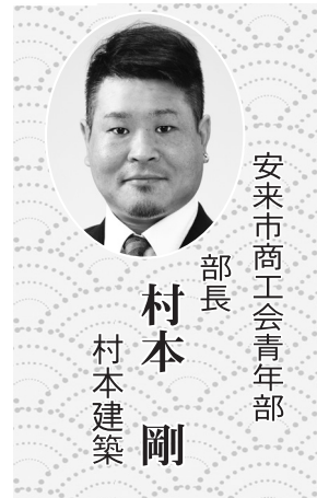
安来市商工会青年部 部長