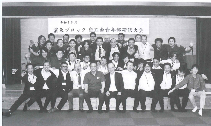
来賓の皆さんと共に出席者全員で記念撮影