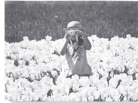
▲最優秀賞 「ハイ、チーズ」