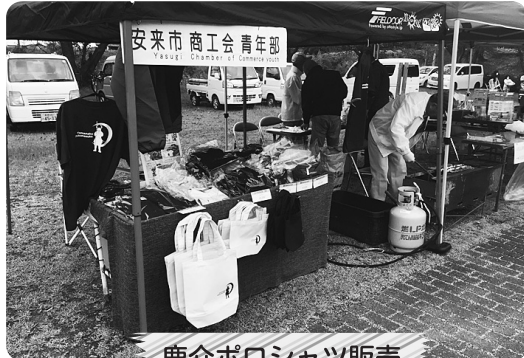
鹿介ポロシャツ販売