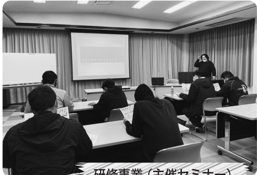
研修事業 (主催セミナー)