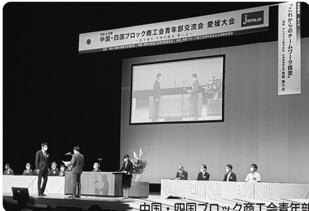
中国・四国ブロック商工会青年部交流会 愛媛大会